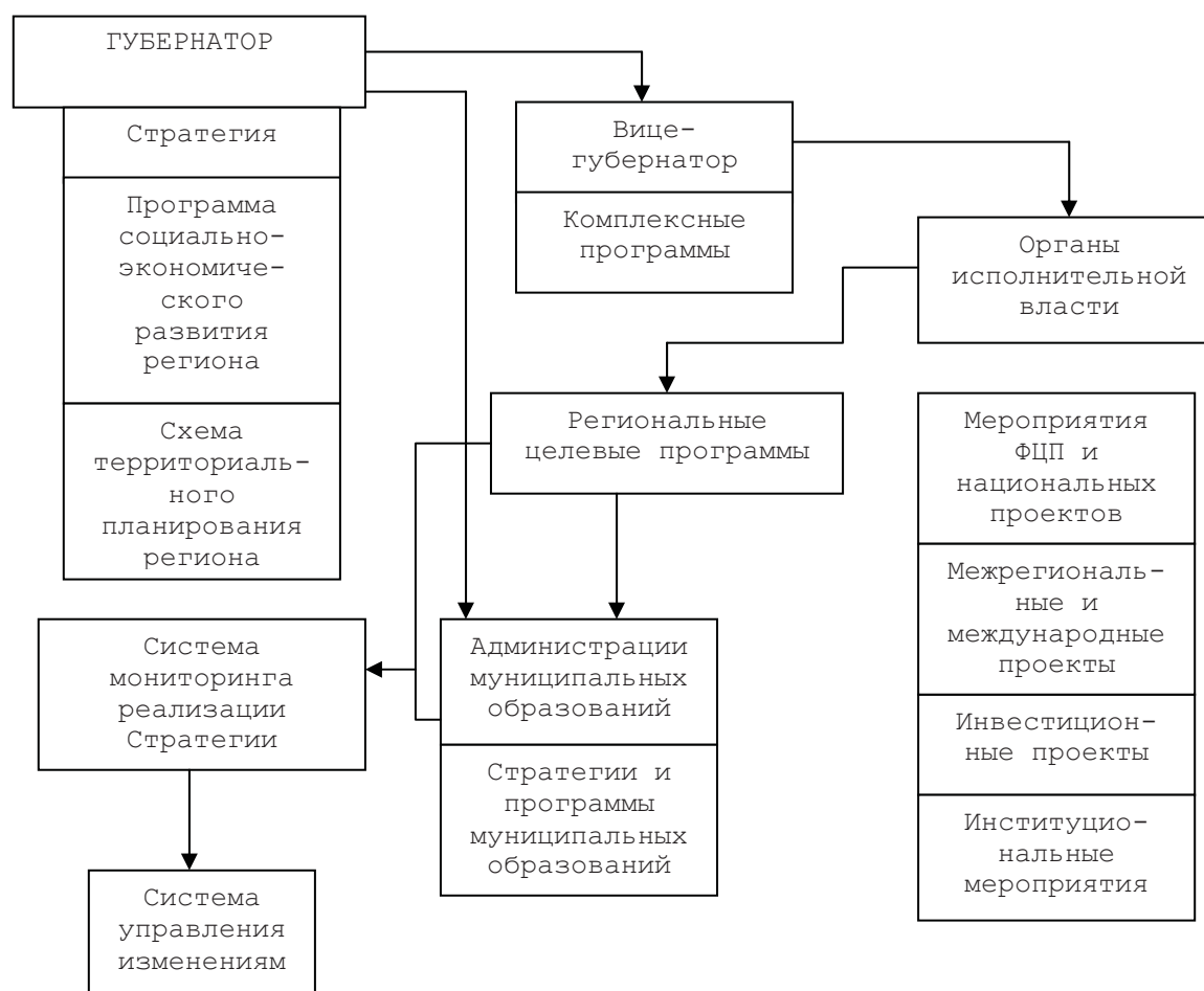
Схема системы реализации Стратегии Брянской области на региональном и муниципальном уровнях

Несмотря на принятие на федеральном уровне ряда основополагающих решений (утверждение стратегических документов: Концепции – 2020, Стратегии социально-